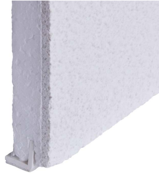
Anschlussprofil L L-Profil