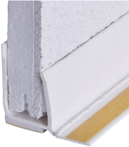
Anschlussprofil U-AL U-Profil mit Abdecklasche