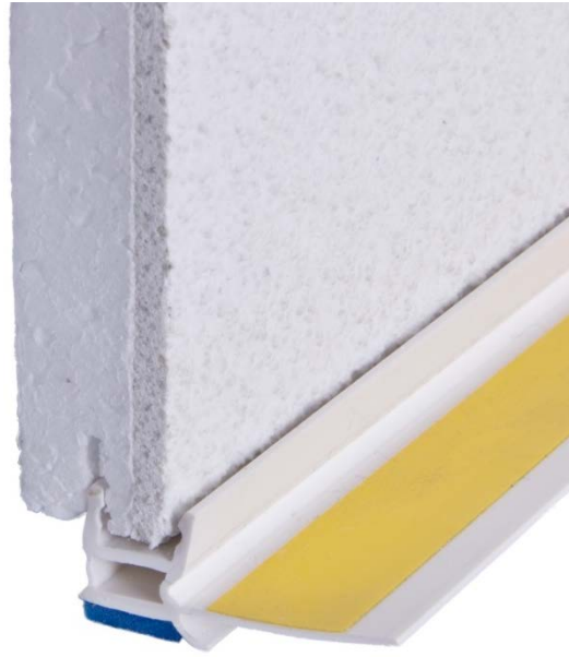
Anschlussprofil U-DA U-Profil mit Dichtlippe und Abdecklasche